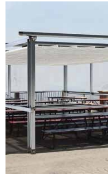
Links: Luxe profiel

Naast de standaard profielen kunt u nu ook kiezen voor een luxere afwerking van uw zonweringsysteem. Deze luxe profielen kunnen bij type 1, 2 en 4 worden toegepast.