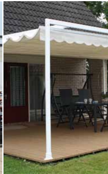
Rechts: Standaard Profiel